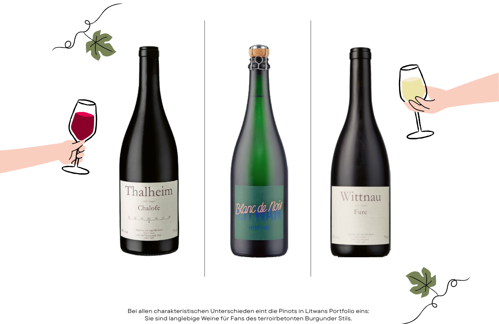
Bei allen charakteristischen Unterschieden eint die Pinots in Litwans Portfolio eins: Sie sind langlebige Weine für Fans des terroirbetonten Burgunder Stils.

Lage ist ein echtes Sahneschnittchen, ich verspreche mir viel von ihr. Gibt in einem guten Jahr zwei Barriques.» Ein nächstes Steinchen im Litwan'schen Mosaik. Hornussen Frohalde – wie die anderen Weine nach der Lage benannt – kommt 2026 erstmals auf den Markt.